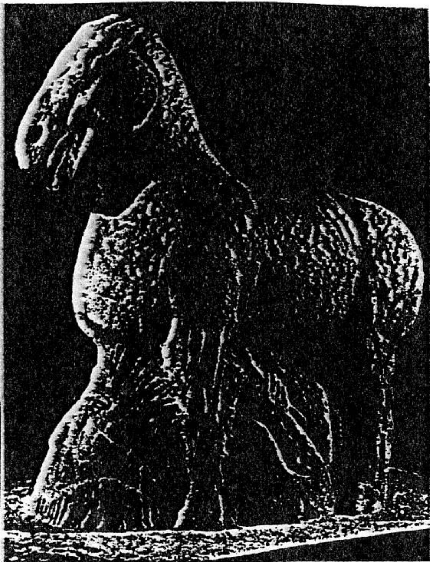
霍去病墓马踏匈奴石雕 西汉 陕西兴平