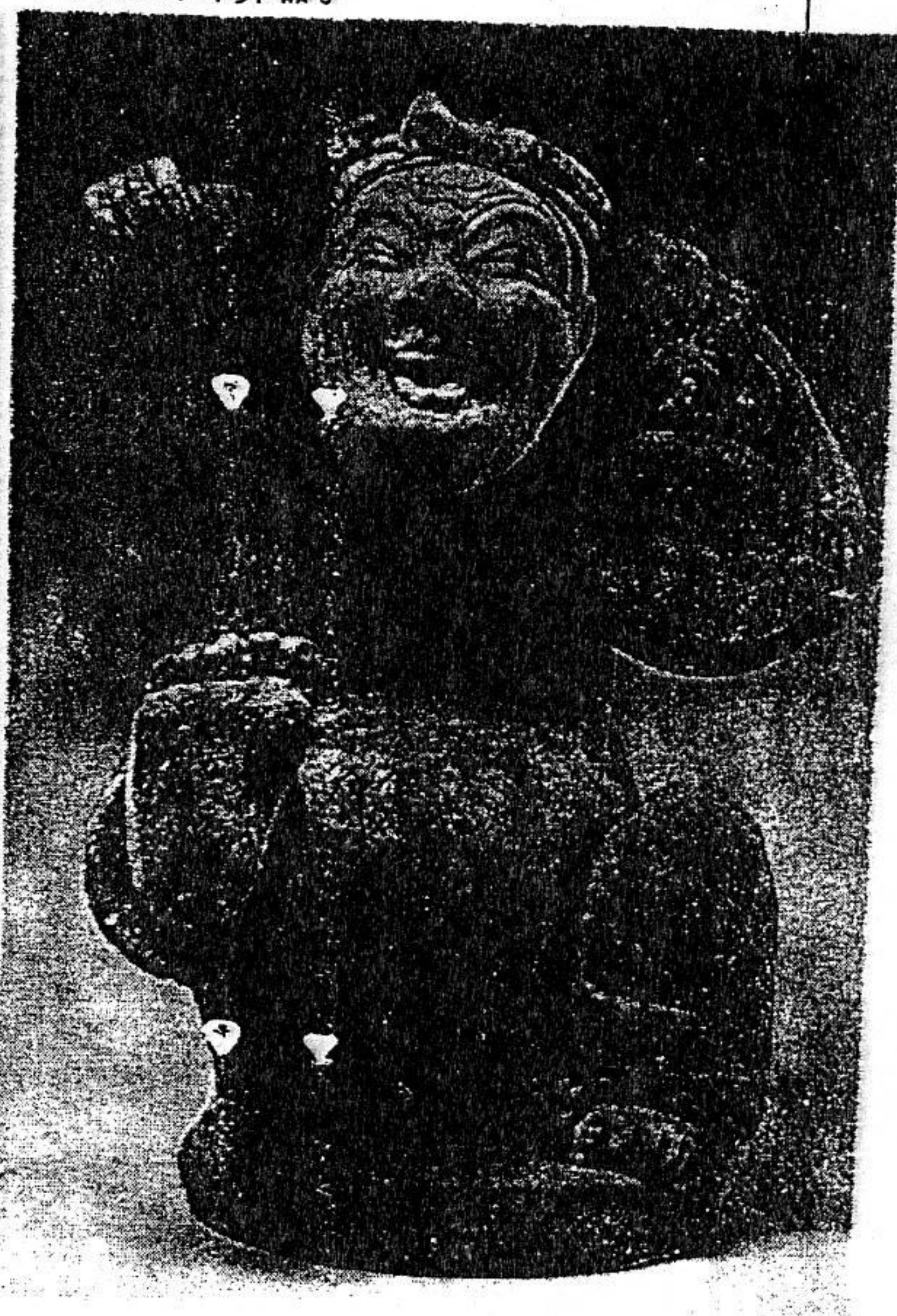
四川成都出土说唱俑. 东汉